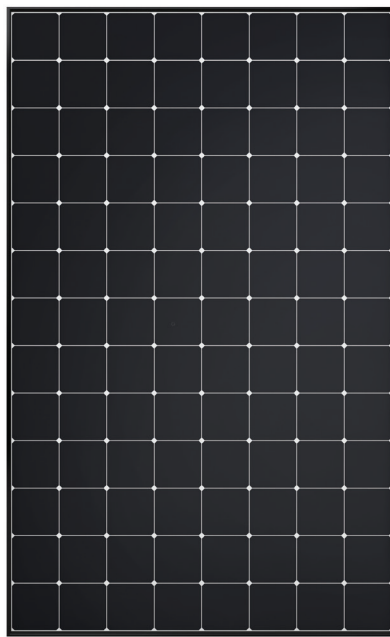
SunPower® Maxeon®-panelen Extra opties voor frame en achterkant beschikbaar.